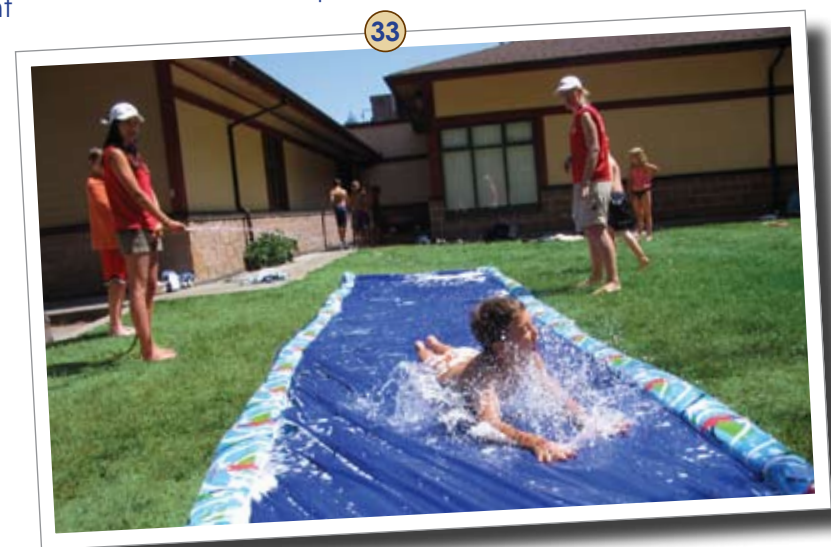
33 Children are having fun at a PSP summer camp in CFB Esquimalt.

New CANEX retail stores are planned to be built in Ottawa, Comox and Winnipeg. Plans are underway for a Borden Pizza Pizza and a barber shop on south side and a new barber shop in Shearwater. There are also plans to renovate the ExpressMart and post office in Edmonton and the Louis St Laurent ExpressMart.