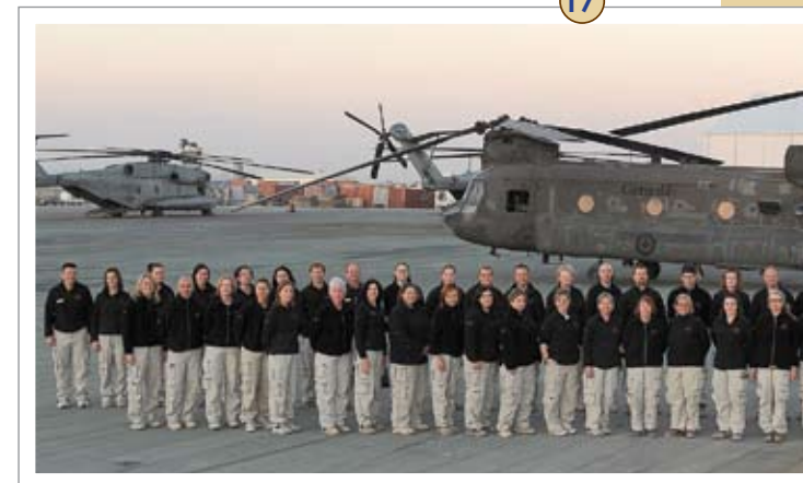
17 PSP Deployed Operations Staff at Kandahar Air Field, Spring 2009.