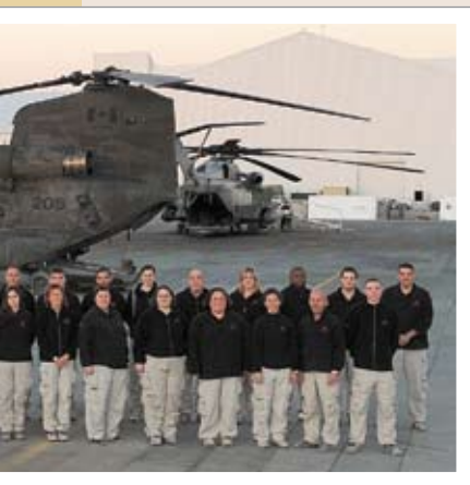
17 Personnel des Opérations de déploiement des PSP au terrain d'aviation de Kandahar au printemps 2009.